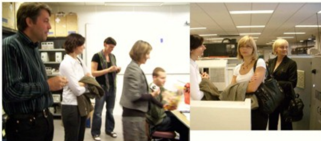
W pracowniach zawodowych

Jak się okazało, wiele różni nasz system oświatowy od islandzkiego. Przede wszystkim nauka w szkole średniej nie jest obowiązkowa, obowiązek szkolny bowiem kończy się wraz z 16 rokiem życia, kształcić zaś można się w każdym wieku, stąd wśród uczniów szkoły w Hafnarfjordur wielu np. 30 i 40-latków, a najstarszy z nich liczył sobie 72 lata! Kształcenie zawodowe ma przede wszystkim charakter praktyczny, nauczycielami są praktycy danego zawodu, którzy nie muszą mieć ani wyższego, ani pedagogicznego wykształcenia. Brak jest klas jako zwartych zespołów uczniowskich i dzienników, a w nich ocen cząstkowych. W związku z takimi realiami rodzice uczniów nie stanowią podmiotu dla islandzkiej szkoły, nie ma wywiadówek, a nawet nie wolno informować rodziców, jako osoby postronne, o wynikach ucznia. Mimo tak ogromnych różnic, a może właśnie dzięki nim, pobyt w Technical College był bardzo pouczający i, co zdawałoby się niemożliwe, podsuwał pewne rozwiązania możliwe do realizacji w ZSOT. Przykład? Kącik rekreacyjny dla uczniów ze skórzanymi kanapami, który wkrótce pojawił się w naszej szkole na półpiętrze.