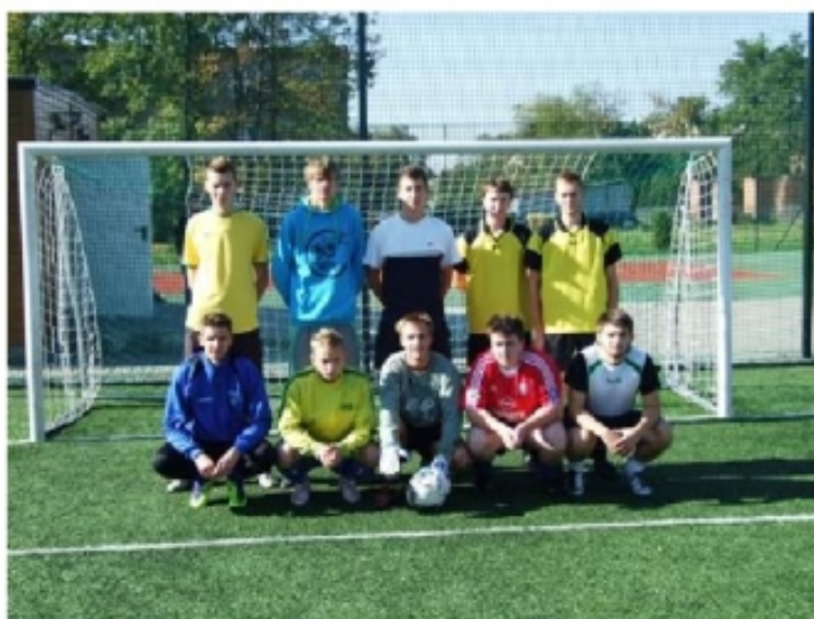
3 TB-LO Mistrzowie Szkoły 2011

Finał: 4TB - 3TB-LO: 2:1 karne (0:0), 2:2, (2:2) bramki: Marzec 31' wolny, 40'+1' - Raszewski 21', 34'