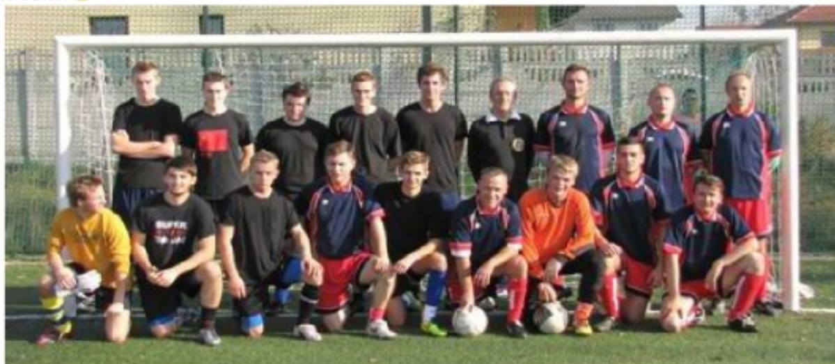
3TB-LO - Reprezentacja Nauczycieli 7:4

Gratulujemy zwycięstwa 3TB-LO i życzymy kolejnych sukcesów tym razem w nauce...! 😊