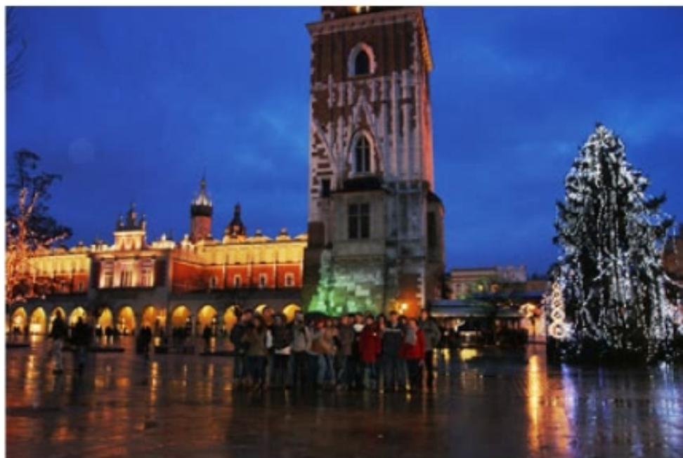
Uczniowie klasy 1 LOB